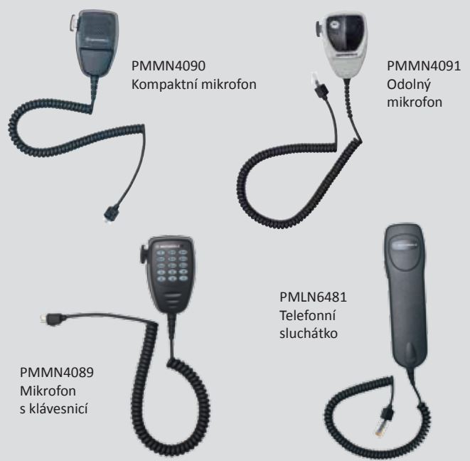
PMMN4090 Kompaktní mikrofon