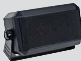
RSN4001 13W externí reproduktor