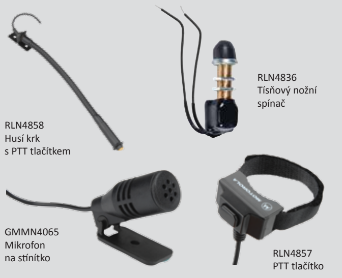
RLN4858 Husí krk s PTT tlačítkem