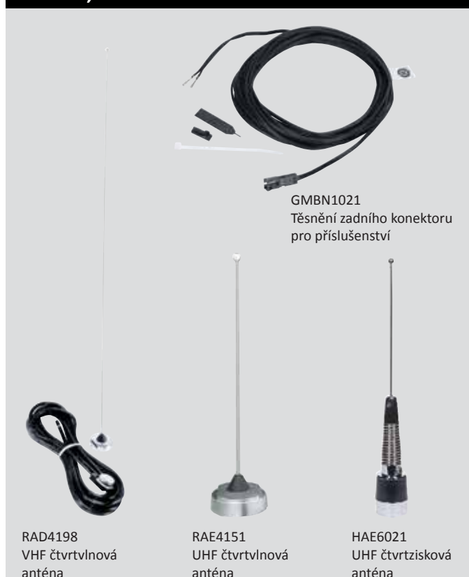
GMBN1021 Těsnění zadního konektoru pro příslušenství