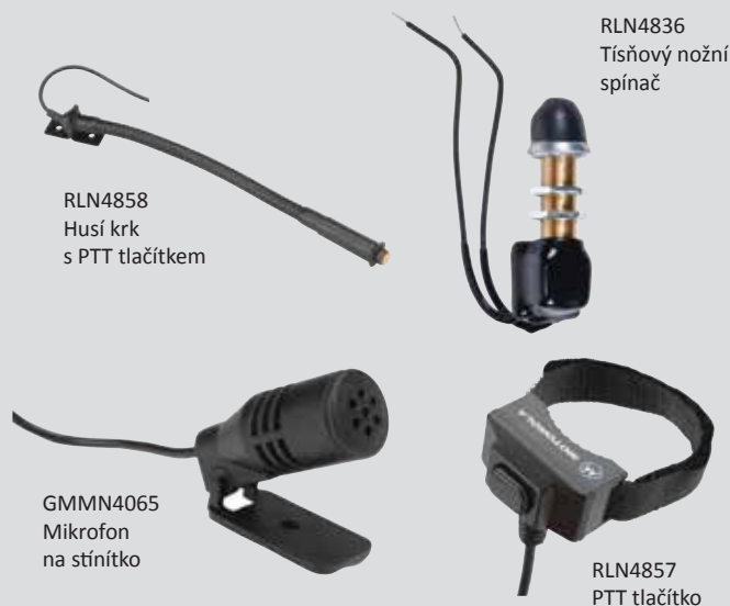
RLN4858 Husí krk s PTT tlačítkem