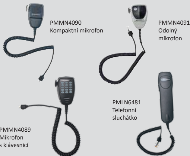
PMMN4090 Kompaktní mikrofon